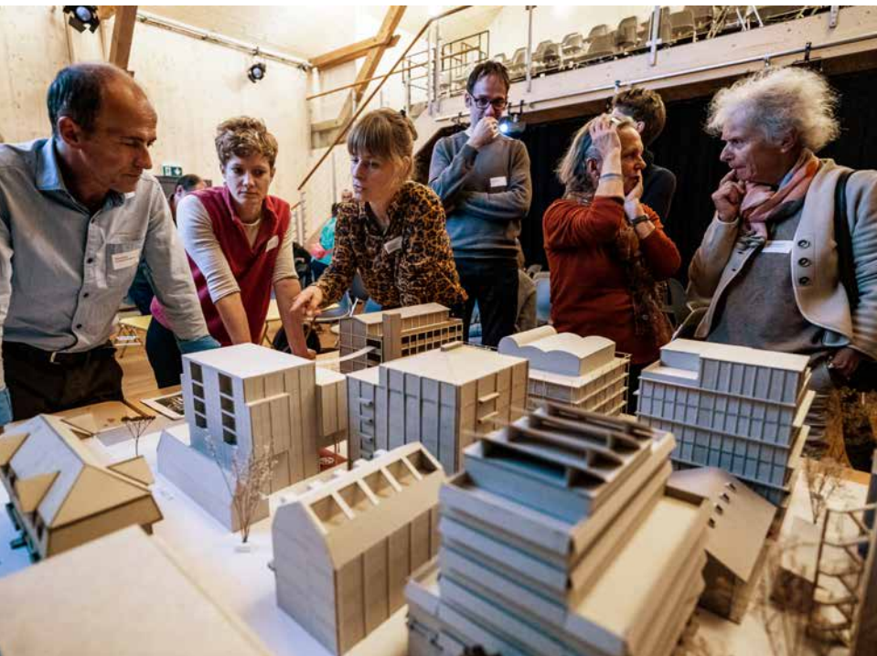
Discussion entre participants autour de la maquette