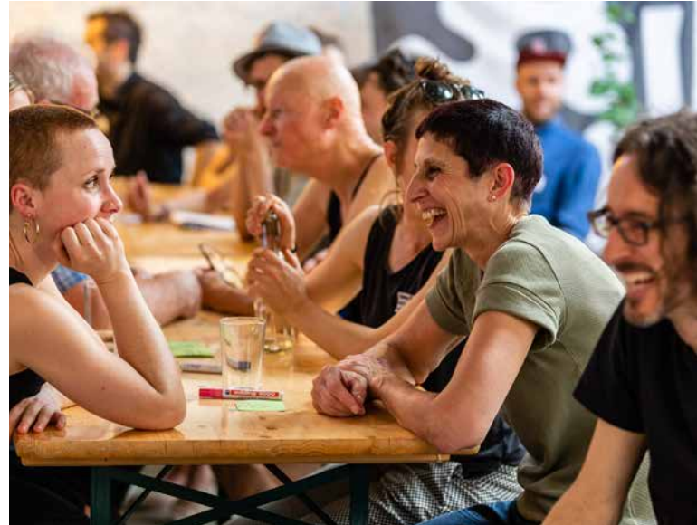
Échanges lors de la phase de dialogue