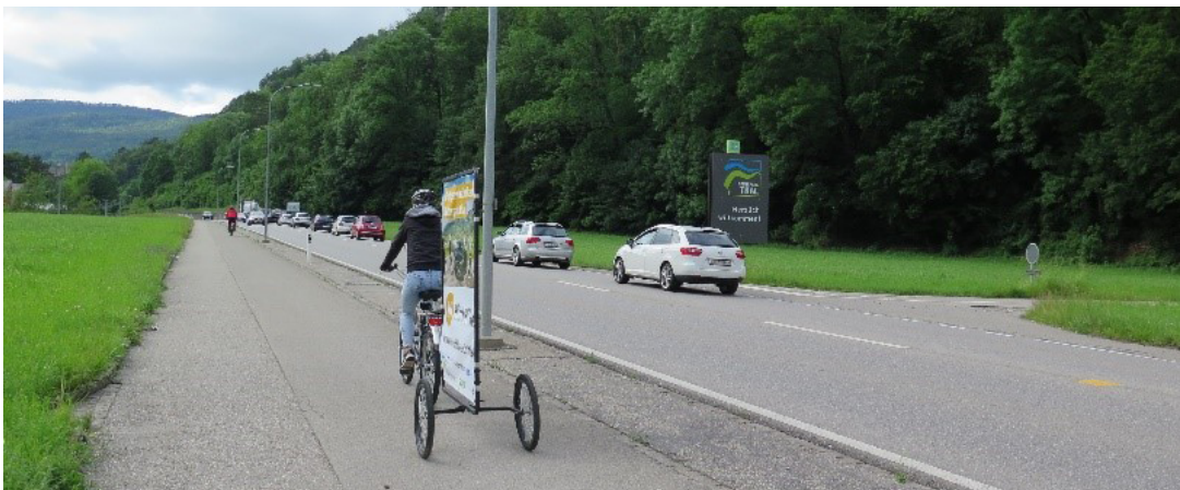
Abbildung 5: Veloanhänger auf der Klus

Zudem fuhr während des Staus ein Fahrrad mit einem Plakat-Anhänger an den stehenden Fahrzeugen vorbei, um auf HitchHike aufmerksam zu machen. Ebenfalls wurde ein Anhänger auf der Klus positioniert. Ab Dezember 2019 wurde in Mümliswil ein zweiter solcher Anhänger positioniert.