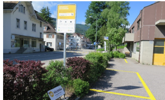
Abbildung 8: Standort HitchHike, Beispiel Welschenrohr

Bei jedem Standort ist eine Stelle errichtet worden, auf welcher das Prinzip von HitchHike erklärt wird. Zudem ist jeweils ein Parkplatz explizit für HitchHike-NutzerInnen vorgesehen, welcher ebenfalls entsprechend ausgeschildert ist (s. Abbildung 8). Für das einfache Auffinden der Standorte auf Google Maps wurden alle Standorte eingezeichnet.