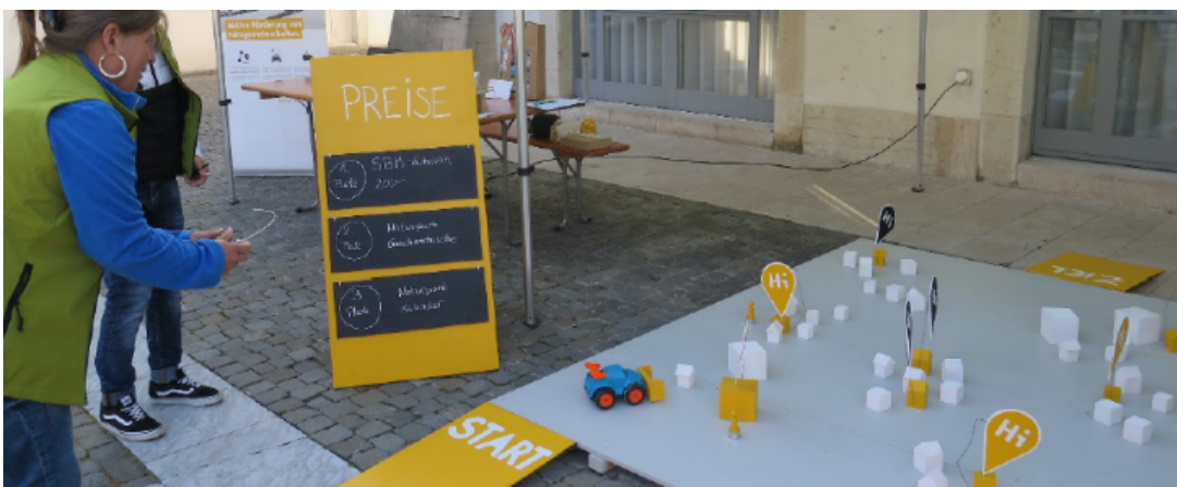
Abbildung 6: Standaktion HitchHike am Naturpark Märet

Verteilt wurde auch Infomaterial zu HitchHike und Interessierte konnten sich vor Ort über den Anmeldeprozess informieren.