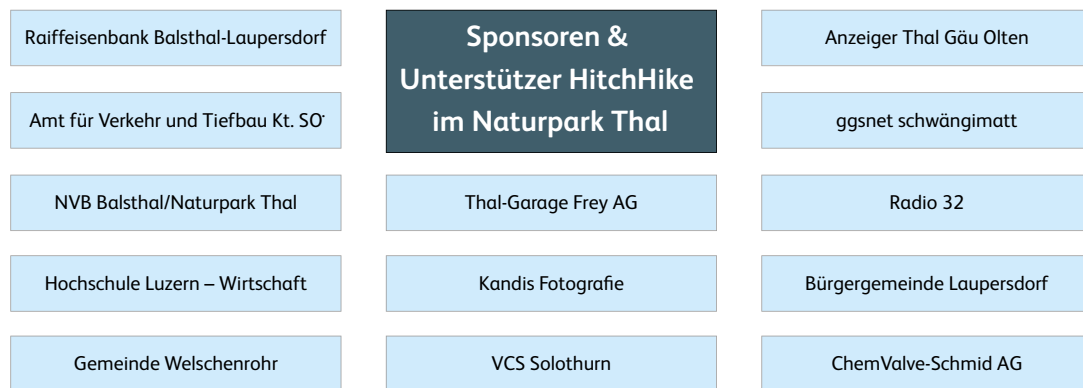
Abbildung 3: Sponsoren und Unterstützer HitchHike im Naturpark Thal