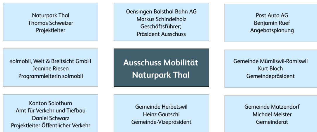
Abbildung 2: Ausschuss Mobilität Naturpark Thal