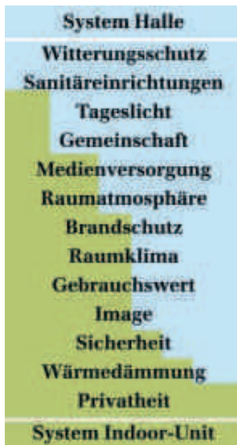
[Abb. 2] System Halle: Symbiose zwischen Halle und Units.

brauchswert, Innenausstattung, Flexibilität, inneres Raumklima. Zum Makrosystem hingegen gehören Anforderungen, die sich durch die Ansprüche der Nutzenden und ihre Beziehungen mit ihren direkten Nachbarn, aber auch dem weiteren Umfeld eines Standorts ergeben: Ensemblewirkung, Raumklima in der Halle, Anpassbarkeit, Community, Aussenbeziehungen usw. Das System Gebäude selbst ist bei dieser Aufgabenstellung eingebettet in das ökonomische, das soziale und das politische System. Die Entwicklungsarbeiten haben gezeigt, dass Mikro- und Makrosystem nicht unabhängig voneinander funktionieren, sondern ineinandergreifen. Für gewisse Anforderungen sind die Lösungen im Objekt umzusetzen, für andere in der Halle, meist aber im Zusammenwirken der beiden Systeme [vgl. Abb. 2]. Je mehr Blauanteil, umso mehr leistet die Halle, je mehr Grünanteil, umso mehr leistet die Unit.