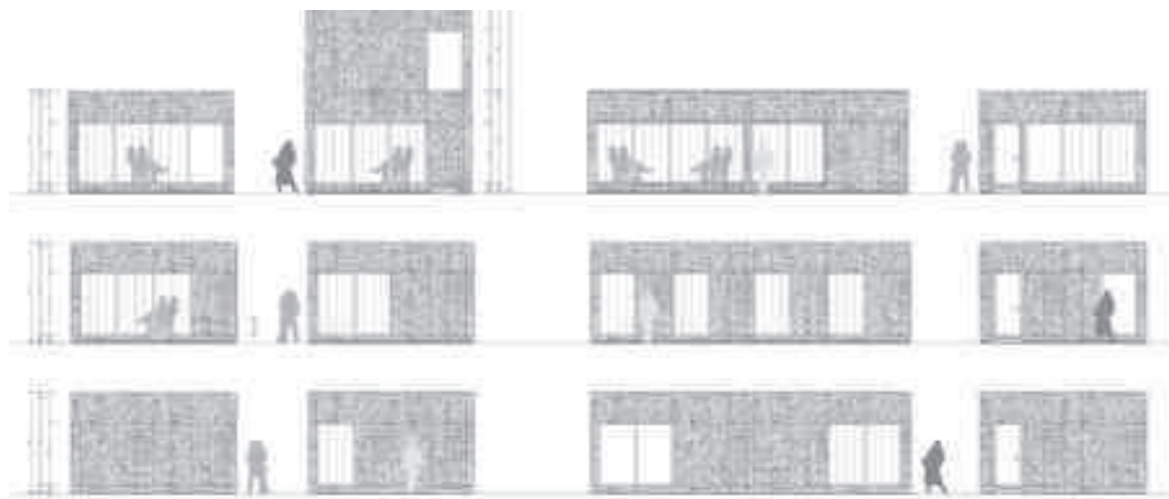
[Abb. 6] Vielseitige Gestaltungsmöglichkeiten dank modularer Wandbauteile.

Auf Produktebene wurde eine neuartige Typologie im Bereich mobiler Bauten entwickelt, die konstruktiv modular und materialtechnisch flexibel den spezifischen Randbedingungen von Industrie und anderen Hallen entspricht [vgl. zu den vielseitigen Gestaltungsmöglichkeiten dank modularer Wandbauteile die Abb. 6]. Was der Normcontainer für den Aussenraum und das Transportwesen bedeutet, 08] können die Indoor-Units für den Innenraum verkörpern. Anders als bei Containern wurde bei den Indoor-Units deren Variabilität und Anpassungsfähigkeit bereits bei der Entwicklung mitgedacht, denn die Rahmenbedingungen und spezifischen Nachfragebedürfnisse ändern sich von einem Anwendungsort zum anderen.